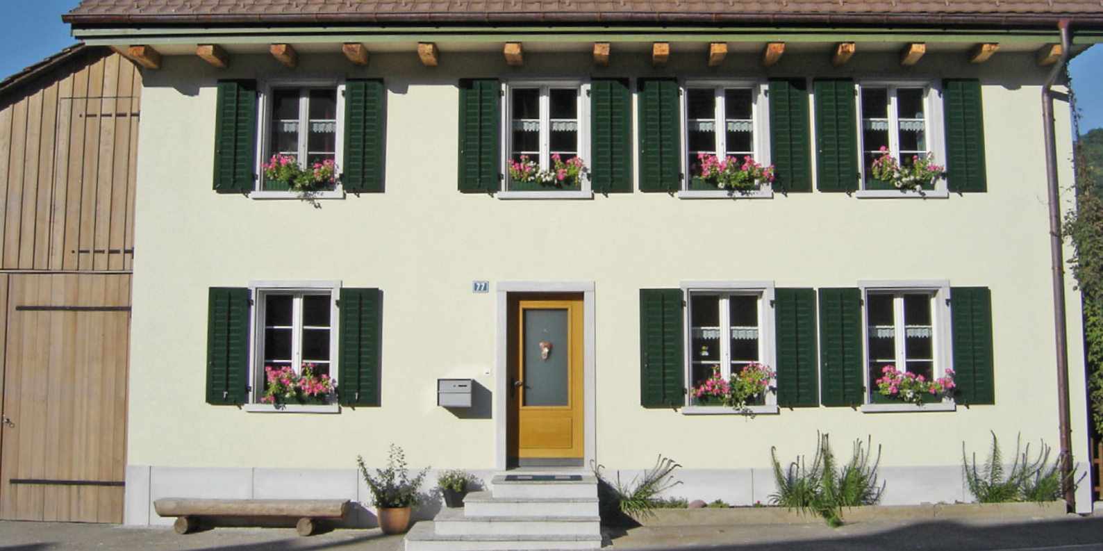
Gewändeelemente aus Glasfaserbeton