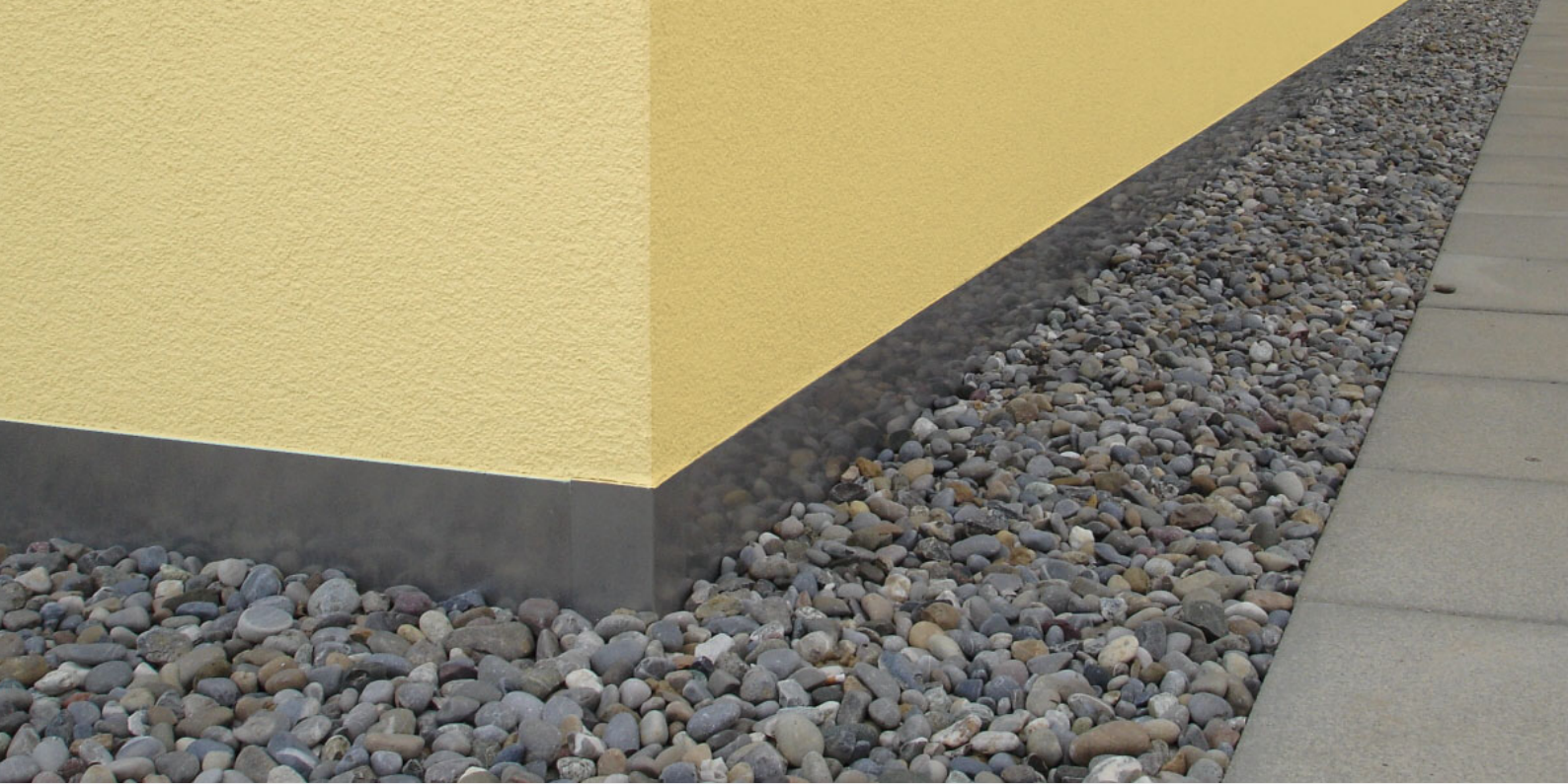
Plinthes en tôle