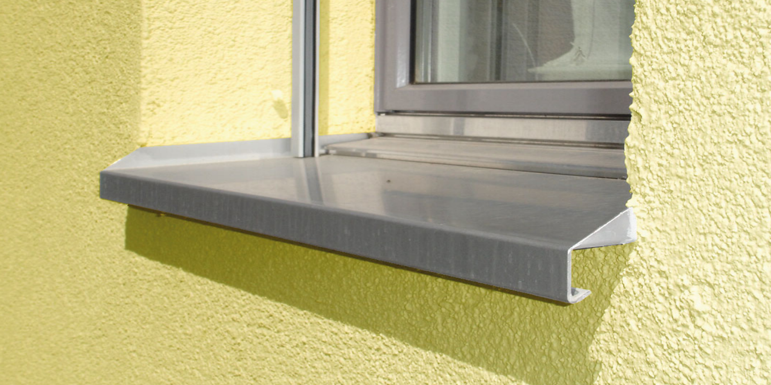
Tablettes de fenêtre en alu avec equerres d'appui