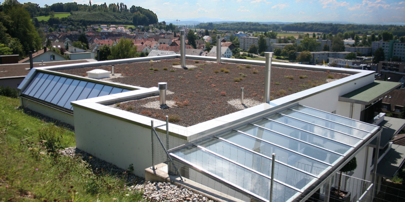
Éléments de recouvrement du toit